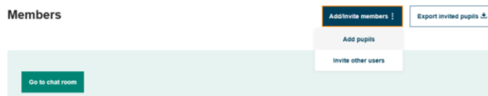
Slika 4. Dodavanje učenika

pupils“. Zatim, unose se podatci učenika, te se generiraju zaporke (Slika 6.) Učenici se logiraju na platformu na adresi https://school-education.ec.europa.eu/en/pupil-login 8 .